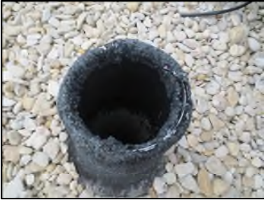
Photo N° 346 AMIANTE CIMENT -- TOITURE TERRASSE Toiture Ventilation haute (Fibres-ciment)

Dossier n°: 2013-09-300 FK DTA PC-21LAC-OPH